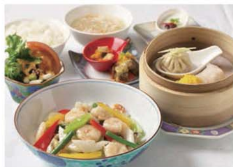
ランチ 海老と野菜のXO醤炒め 1,600円(税込)

旬の魚介を和風グラタンにアレンジ、 とろけたチーズが海老や帆立の旨味を更に引き出す一品