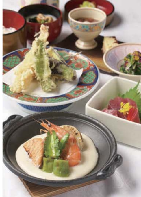
ランチ 海鮮和風グラタン 2,300円(税込)

厳選した地元旬の食材を中心に 素材の力をそのままいただく和琉料理、 日本中国料理協会技能厚労者を受賞した シェフによる本場仕込みの中国料理。 技の共演をお楽しみください。