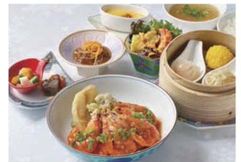
ディナー 海老のチリソース 2,200円(税込)

海老：血中のコレステロールを下げることで動脈硬化の予防に効果のあるタウリン、血液サラサラ効果のあるDHAやEPA、便秘や冷え性に効くといわれるキチン質など、女性にとってうれしい効能がたくさん得られるメニューです