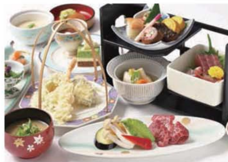
ディナー 和味(なごみ)膳 4,000円(税込)

栄養価の高い海老を殻ごと揚げることで、海老本来甘味とカリカリの食感を 楽しみ、豆板醤のきいたオリジナルソースがとても合う一品