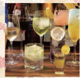
様々なドリンクをご用意。