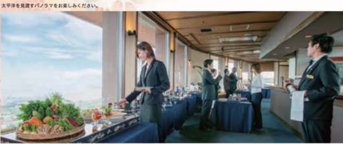
太平洋を展望するパノラマをお楽しみください。

パーティープラン(2時間) ※要予約 7日前 忘年会、歓迎会、分散会など 様々なシチュエーションでご利用頂けます。 お一人様 5,000円~ フリードリンク付き (サゼンスター、ウイスキー、泡盛、ワイン、カクテル、ソフトドリンク) ※20名様よりご利用可能 その他、家族友人同士での食事会、模合等のご予約も承ります。